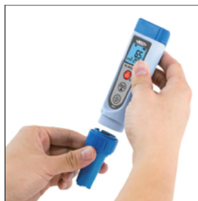
同系列电极可相互更换